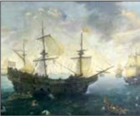
Armada voor Vlaamse Kust

den: een zeestorm doet hun schepen uiteendrijven! Onverrichter zake (= zonder veel te kunnen doen) moet de Armada terug!