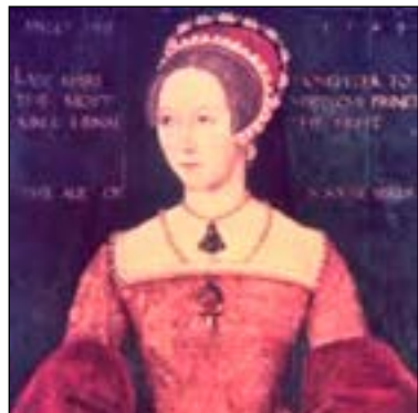
Maria I de Katholieke

En nu is zijn zus Maria I aan de beurt. Zij is katholiek gebleven. Dus: Anglicaanse Kerk afgeschafte en Engeland weer katholiek! Al de leiders die in dienst van haar vader Hendrik katholieken ter dood hebben gebracht of het geloof zijn gaan vervalsen, laat Maria/Mary op haar beurt terechtstellen. Maar nu komen de nieuwe protestanten in opstand (1554)! Ook zij worden ter dood gebracht: 284 stuks. Vaak genoeg: op de