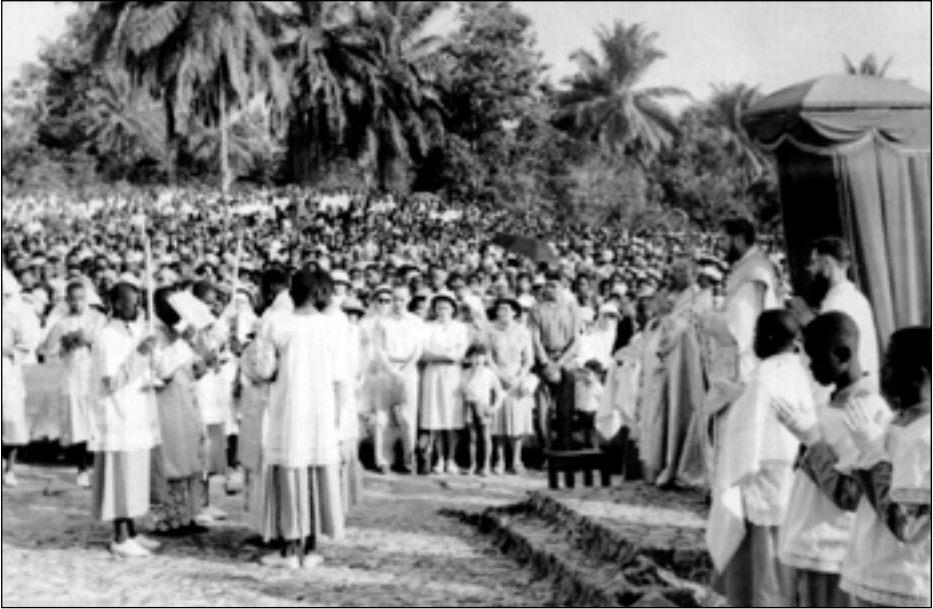
Mgr. Lefebvre in Kameroen Yaoundé 1951

recht om hem te dwingen en niemand heeft het recht om hem te beletten een goddelijke openbaring aan te nemen of voorzichtig de daarmee overeenstemmende uiterlijke godsdienstige handelingen te verrichten.