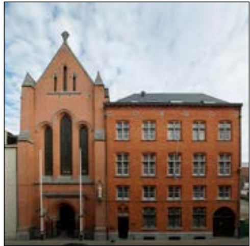
Priorij v.h. Allerheiligste Sacrament, Hemelstraat 23, B 2018 Antwerpen

O Wijsheid van het H. Hoofd, leid ons op al onze wegen, O Liefde van het H. Hart, verteer ons met Uw vuur!