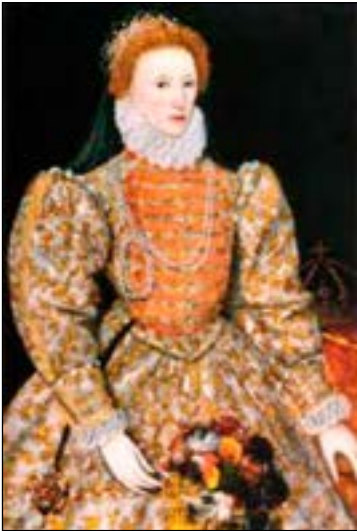
Elisabeth I - begin regering

brandstapel. Niet mooi, maar voor die tijd niet ongewoon. Toch krijgt katholieke Maria daarna als enige de bijnaam “Bloody Mary” (= “Maria de Bloedige”). Waren haar vader en de groten onder haar broertje zoeter? Ook Maria de Katholieke regeert niet lang. Komt er nu onbloedigere Tudor?