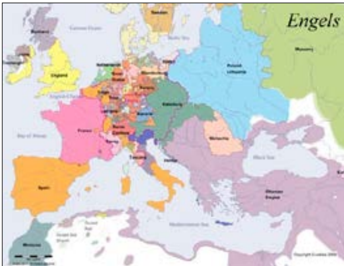
Kaart Europa rond 1600

nastie (= vorstenfamilie) van de Tudors die er dan regeert, verandert regelmatig eens van godsdienst. En wie dan niet op tijd ja-knikt, kan gemarteld, opgehangen of levend verbrand worden. Of een “mix” van al die dingen.