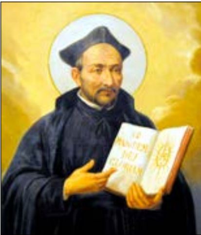
H. Ignatius van Loyola