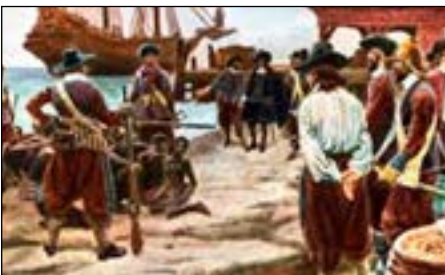
Hawkins - Slavenhandel