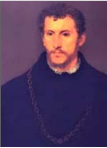
Edmund Campion - Terug in Engeland

op geld uit te zijn! Let op! Elisabeth heeft overal in het land “speurhonden”, en ook in het buitenland zijn Engelse spionnen! Sterk de goede, lijdende katholieken! Vaar nu! Gods zegen!”