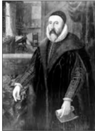
Astroloog John Dee

Buurland Schotland is geen rustiger plaats dan Engeland. Katholieke Ko-