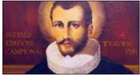
Edmund Campion - Briljant

Een paar jaar later studeert briljante Edmund aan de universiteit. Weer