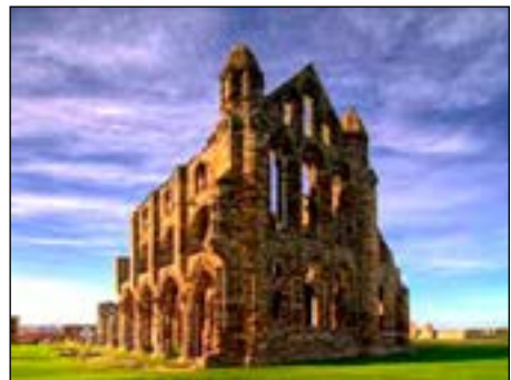
Kloosterruïne in Engeland

lieke Engeland ligt bezaaid met kloosters. Hendrik pakt ze af en verkoopt ze! En voor wie ze koopt, interesseert meer de grond dan het gebouw of de mensen. En dus gooit Hendrik alle godgewijde kloosterlingen, monniken en zusters op straat! De kloosters worden ruïnes (kapotte gebouwen). De kopers mo-