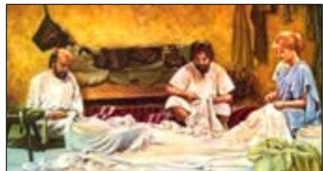
Paulus bij Aquila en Priscilla

Het zijn niet alleen de Apostelen geweest, die aan de uitbreiding van de Kerk werkten. We zien hen dadelijk medewerkers aanstellen in het bewustzijn, dat het werk ook na hun dood moet worden voortgezet: tot het einde van de tijden. Die medewerkers zijn geestelijken, die aangesteld worden door wijding, maar ook leken, die ofwel van God buitengewone gaven ontvingen ofwel allerlei diensten verrichtten, zoals Aquila en Priscilla en zoveel anderen, die in de Handelingen en de Brieven worden genoemd. Het is niet vermetel te veronderstellen, dat na het eerste begin de leken, die in de Kerk waren opgenomen, op hun reizen het Christendom hebben bekend gemaakt; men denkt hierbij aan soldaten en ambtenaren en kooplieden, die het hele Romeinse Rijk rondtrokken langs het uitstekende weggennet te water en te land.