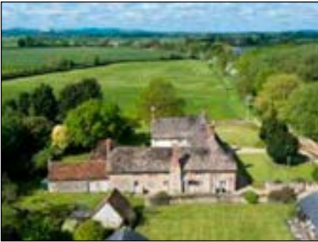
Lyford Grange - arrestatieplaats

te verstaan. Aangeboden door de koningin, Elisabeth, zelf! Campion: “Dat kan ik nooit met een goed geweten doen!”