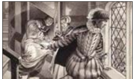
Priest hole doorzocht

"Je kan dan bij ons bisschop of zelfs aartsbisschop van Kantelberg worden!" In de Anglicaanse kerk, wel