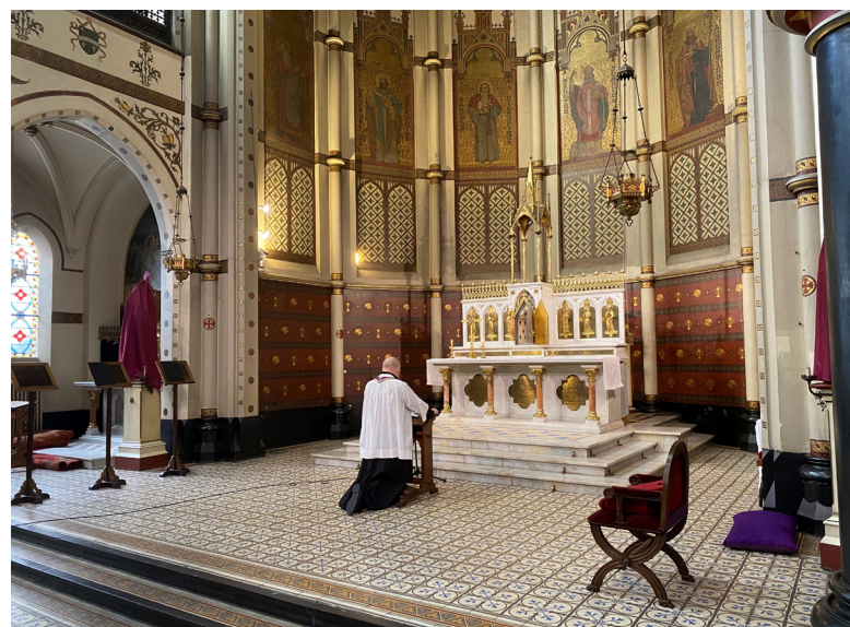
Kruisweg voor Goede Vrijdag. Heer ontferm u over ons, zondaars, en vergeef de dwalingen binnen uw H. Kerk.

Vertaling en commentaar: In onze hoedanigheid van bedienaren des Heren en herders van zijn kudde verzetten wij ons plechtig tegen het veralgemeende schandaal van een publieke en permanente aanzet tot de ondeugd van onzuiverheid en de zonden van de wellust. Sommigen beweren dat het eenvoudigweg om ‘ongeordende erotiek’ gaat, alsof een bepaalde erotiek geordend zou kunnen worden genoemd. Nu we toch zover zijn, waarom dan ook niet spreken van een geordend alcoholisme? Erotiek—want het woord is in de mode—moet worden begrepen als een bijzonder ernstige verstoring van de morele orde: het slaat vandaag op een stelselmatig aangekweekte en spitsvondig gerechtvaardigde staat van ontaarding. Laten geloven dat erotiek als zodanig zich niet zou lenen voor deze of gene morele kwalificatie, dat ze nu eens verkeerd, dan weer geoorloofd kan worden genoemd, naargelang het geval, dat is de betekenis van de woorden verdraaien, de morele begrippen verduisteren en daardoor de gewetens corrumperen. Erotiek kan niet neutraal worden genoemd, kan niet de ene keer worden beschouwd als gepast en de andere keer als onzedelijk volgens de graden of de voorkeur. Ze is als zodanig altijd een misbruik, zoals ze als zodanig altijd schuldig is. Erotiek is niet neutraler dan alcoholisme neutraal is, dan de overspelige of de drugsverslaafde neutraal is. Er bestaat niet zoiets als ‘geordend’ overspel, zoals men zou kunnen gaan denken; elk overspel is ongeordend per definitie. Zo ook erotiek.