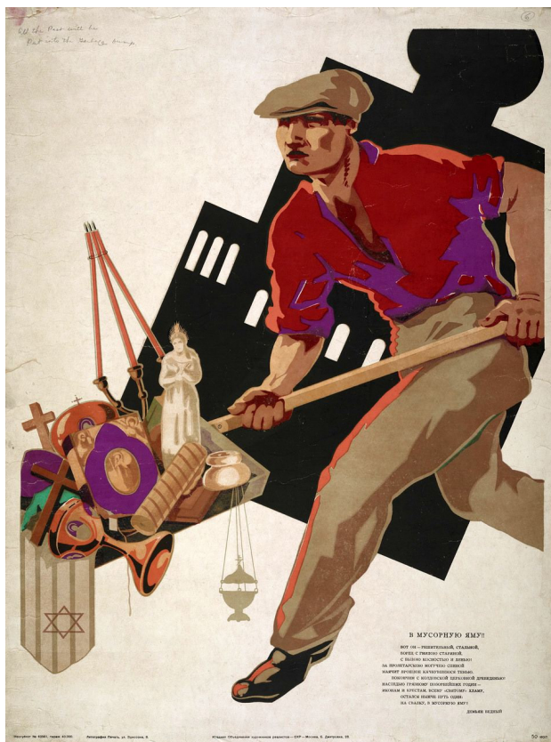
Sovjetpropagande tegen de godsdienst.

Brief aan de katholieken van Senegal (1950)