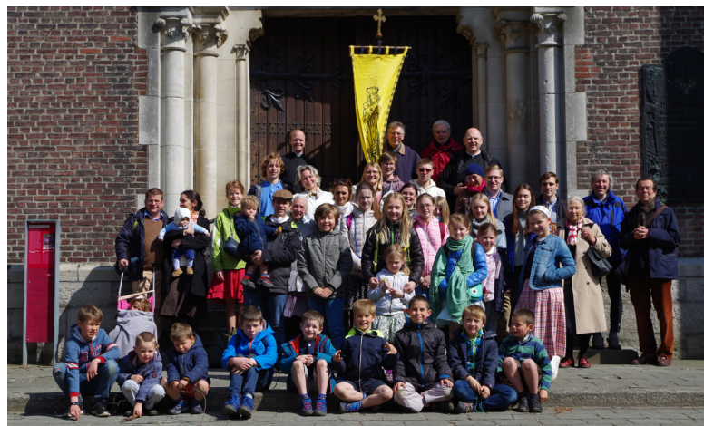
Priorijbedevaart naar O.L.V. van Oostakker

Het begin van het werk van de FSSPX werd ongetwijfeld gekenmerkt door de meest heldere en transparante juridische rechtsgeldigheid. Het is niet zo dat Marcel Lefebvre hier in al zijn goedheid naar op zoek was. De feiten zullen aantonen dat het, meer dan ooit, de verdediging van het katholiek Geloof is dat het baken zal zijn dat hem in staat zal stellen om sereen de verschrikkelijkste stormen van beschuldigingen en vervolgingen te doorstaan.