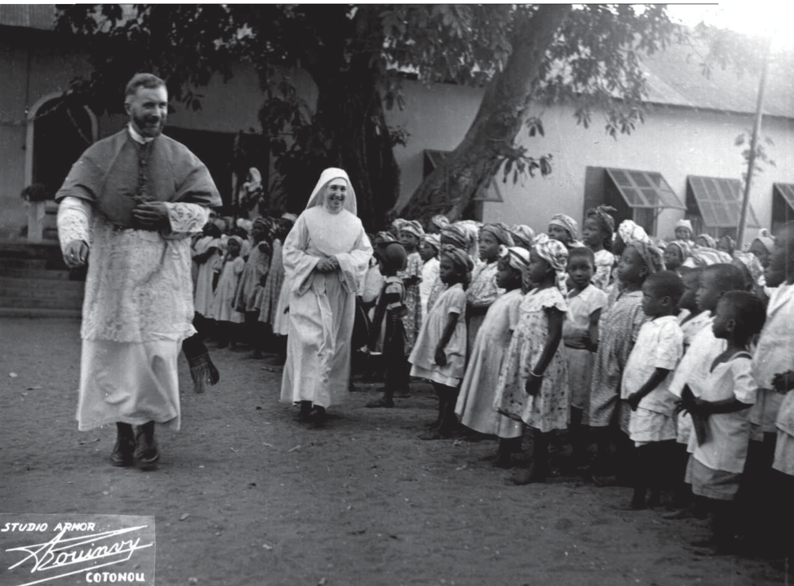
Mgr. Lefebvre op bezoek in Cotonou (Benin) in 1953.

mensen die niet naar de kerk komen, zullen naar de pater, gezeten te midden van de mensen van het dorp, komen luisteren. Deze beoordeling moet echter niet in de kerk gebeuren.