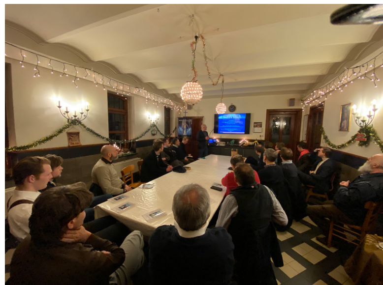
Maandelijks bijeenkomst van de Militia Immaculatae.

zeggen dat wij de wereld en onze familie moeten verlaten om in een klooster in te trekken. Neen, men kan zich blijven inzetten voor al deze activiteiten in zijn huidige levensstaat. Nu, wij offeren zelf deze zaken niet op maar eerder de Onbevleete, wiens bezit wij zijn geworden, offert deze zaken zelf op. En Zij offert deze op, niet als onze zwakke werken, die vol van onvolmaaktheden zijn, maar eerder als die van Haarzelf. Omdat wij aan Haar toebehoren met al onze bezittingen. Daarom behoren al onze werken ook toe aan Haar. De Onbevleete Maagd echter, kan niets onvolmaakt of imperfect aan God offeren. In Haar onbevleete handen worden onze werken onbevleet, puur en dus onvergelijkbaar meer waardevol.” (Eerste rondzendbrief voor Duitsland, 10 juni 1938).