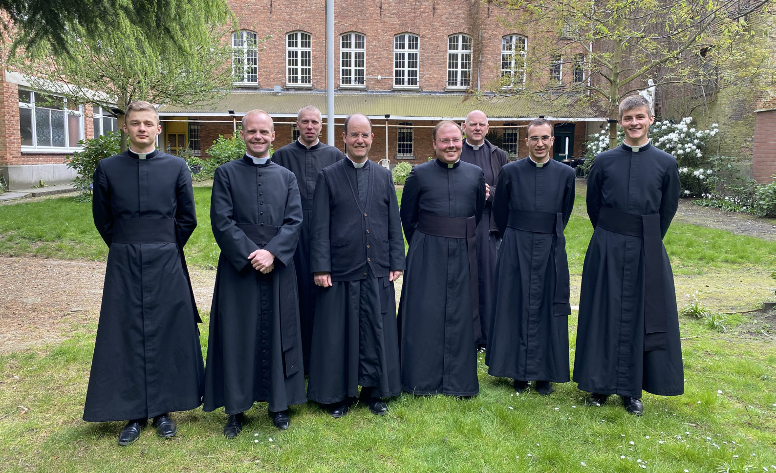
Bezoek van 3 van de 5 seminaristen van het district Benelux in de Hemelstraat.

priester komt niet meer naar voor. Er kunnen zeker enkele uitzonderlijke gevallen zijn die u zelf moet beoordelen. Maar ik vraag u eerder strikt te zijn op dit gebied.