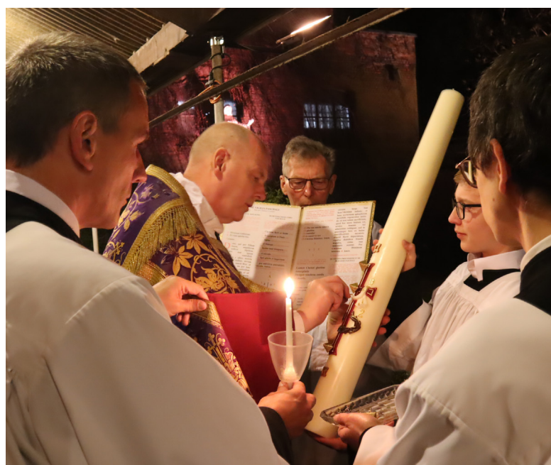
Na twee jaar coronatijd konden wij opnieuw het vuur en de paaskaars tijdens de paaswake buiten zegenen.