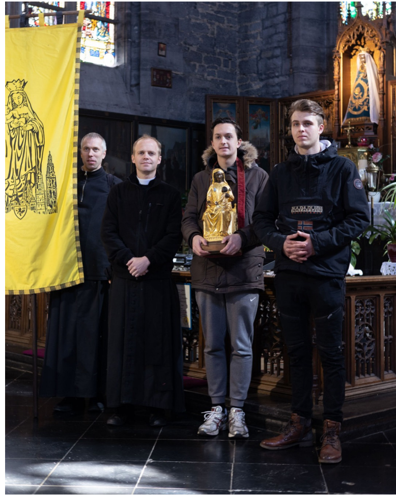
De Vlaamse delegatie vóór het beeld van O.L.V. van Walcourt.

Dit houten beeldje is zittend (Sedes Sapientiae) en van gemiddelde grootte. Aan de verering die de inwoners van Walcourt in de Middeleeuwen voor het miraculeuze beeld van Onze-Lieve-Vrouw koesterden, heeft het de zilveren platen te danken