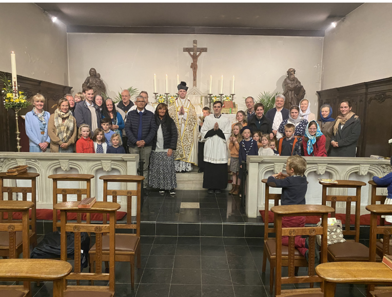
Op zondag 1 mei: toewijding aan de Immaculata van de MI te Antwerpen (bovenste foto) en te Gent (onderste.)

uitgerust en aangesloten op de gewone straatverlichting. “Ons Maria” zal dus elke avond verlicht worden en ons licht geven.