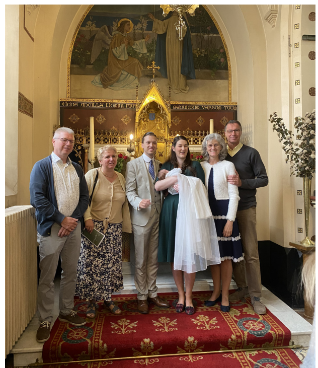
Het H. Doopsel van Raphaël.

1 Cf. het artikel Magistère ou Tradition vivante in het nummer van februari 2012 van Courrier de Rome .