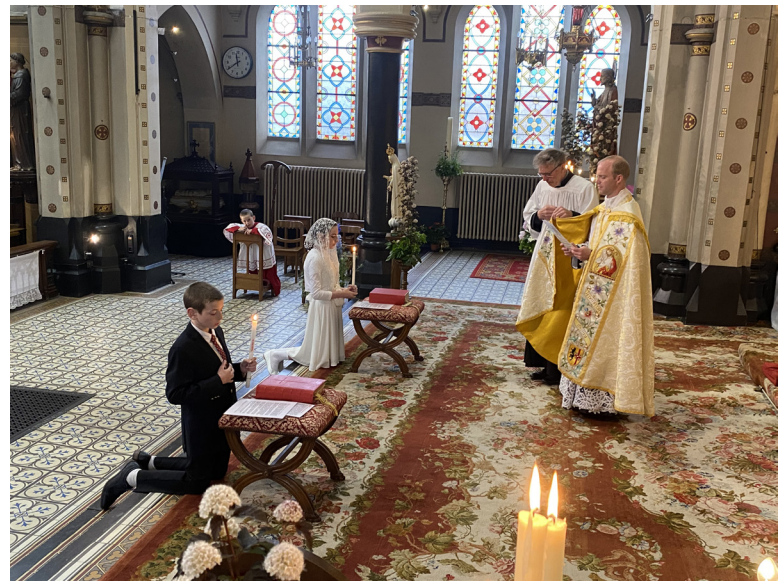
Plechtige Communie te Antwerpen, zondag 29 mei.

het ministerie van de eenheid in zijn Kerk heeft toevertrouwd”: dat verwijt wordt Mgr. Lefebvre naar het hoofd geslingerd door degene die zelf als eerste de fameuze kerkelijke band breekt, door zich te ontdoen van wat diens voorgangers hebben geleerd. Hoe kan Johannes Paulus II immers beweren in gemeenschap te blijven met Pausen Leo XIII, Sint-Pius X, Pius XI en Pius XII, terwijl hij tot tweemaal toe (in 1986 en in 2002) de schandalige ceremonie van Assisi heeft voltrokken? Het uitgangspunt van die oecumenische en interreligieuze handelwijze wordt uitdrukkelijk verworpen door de Encycliek Mortalium animos van 6 januari 1928, geschreven nauwelijks zestig jaar vóór de wijdingen van Ecône.