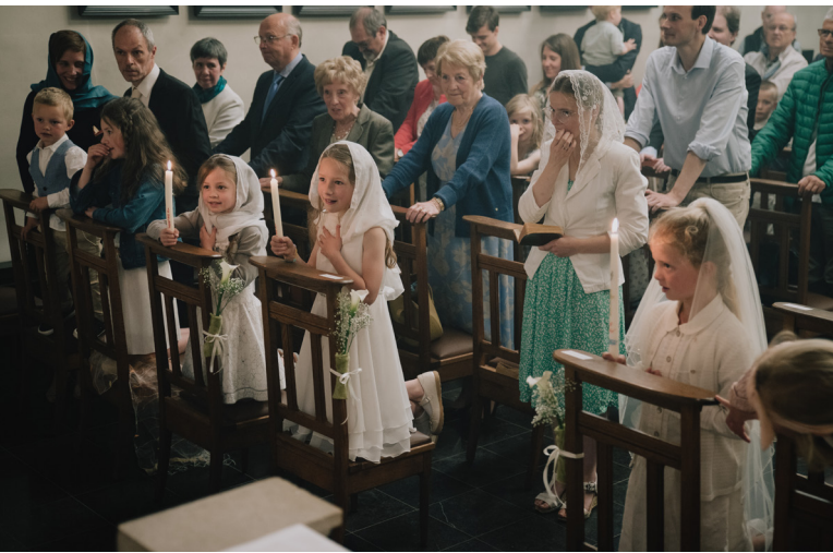
Eerste Communie te Gent, zondag 22 mei.

een ander. Het inzicht is er en wordt steeds beter: het schrijdt voort, inderdaad en vooral dankzij de verkondiging van de Paus en de bisschoppen. Maar het doorgeven is geen voortschrijdend inzicht in de zin dat de Kerk nog niet op definitieve wijze de volheid van de waarheid zou bezitten. Met die evolutionistische opvatting van de Traditie heeft het concilie de deur geopend voor de “hermeneutiek van de hervorming”, waarvan Benedictus XVI zich tot theoreticus heeft gemaakt in zijn Toespraak van 22 december 2005. 1