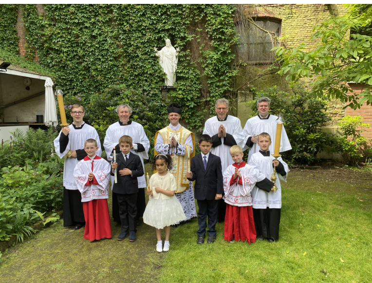
Eerste Communie te Antwerpen, donderdag 26 mei.