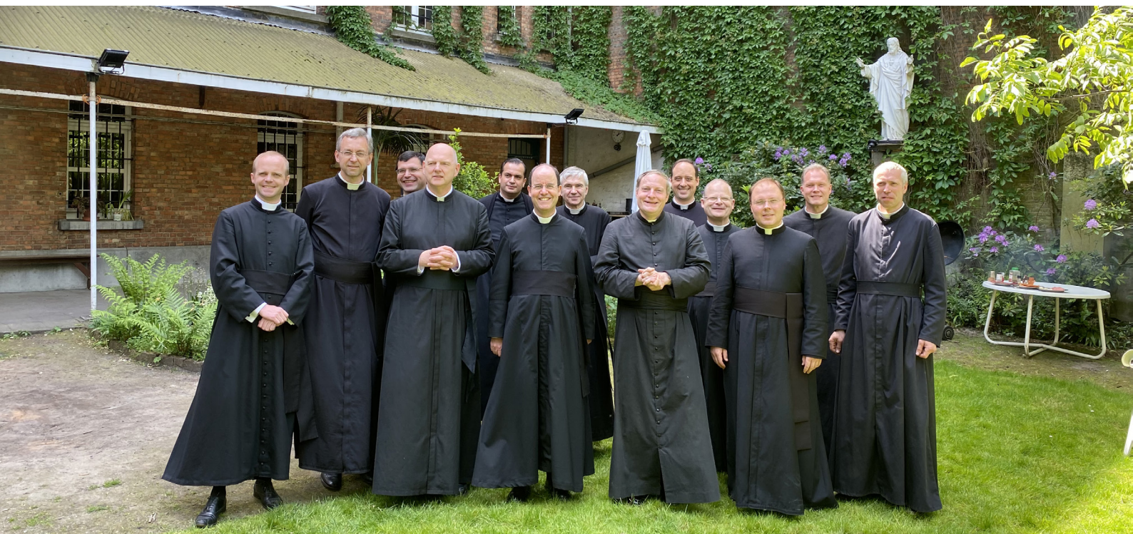
Districtvergadering te Antwerpen, 18 mei 2022, met alle priesters en broeders van het district Benelux.

Als we het gezag, dat wij hebben, niet bekijken als een kwaliteit die ons toekomt, maar in tegendeel als een eigenschap, die wij niet waardig zijn, dan zullen wij steeds bereid zijn om ervan ontheven te worden. Als we voor ditzelfde gezag evenveel respect zouden hebben als voor iets goddelijks, dan zouden wij er ons voor hoeden het te bagatelliseren. Het is door dit gezag dat de wil van God zich manifesteert. Deze wil van God is echter het brood voor de echt christelijke zielen: Meus cibus est ut faciam voluntatem Patris mei (Mijn voedsel is het de wil van de Vader te doen) .