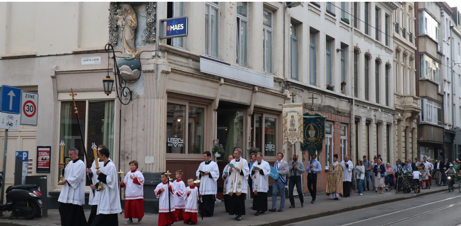
Mariahulde van de Militia Immaculatae met de ganse parochie tot het Mariabeeld van de Korte Leemstraat op woensdag 18 mei.

- “Ik mag wel mijn leven geven voor Hem die voor mij gestorven is.”