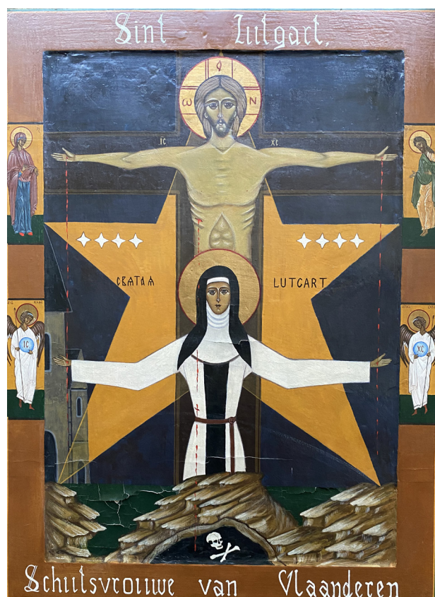
Schilderij van de H. Lutgardis in het EK-lokaal van de Hemelstraat, door dhr. Oscar Wagmakers.