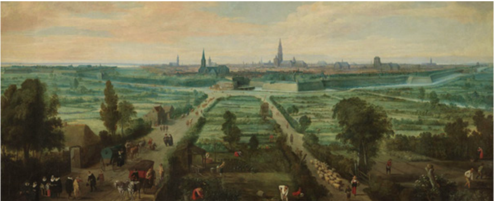
Uitzicht op Antwerpen met links de Mechelsesteenweg en rechts de Lange Leemstraat, door Jan Wildens, 1636 (Rijksmuseum Amsterdam)