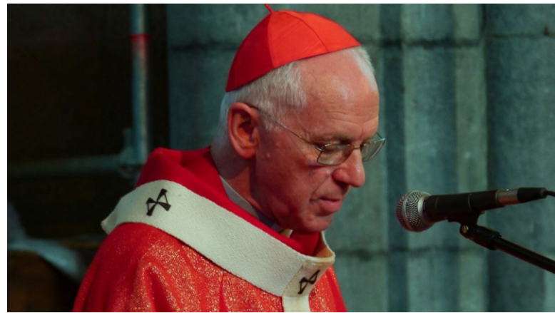
Kardinaal Josef De Kesel