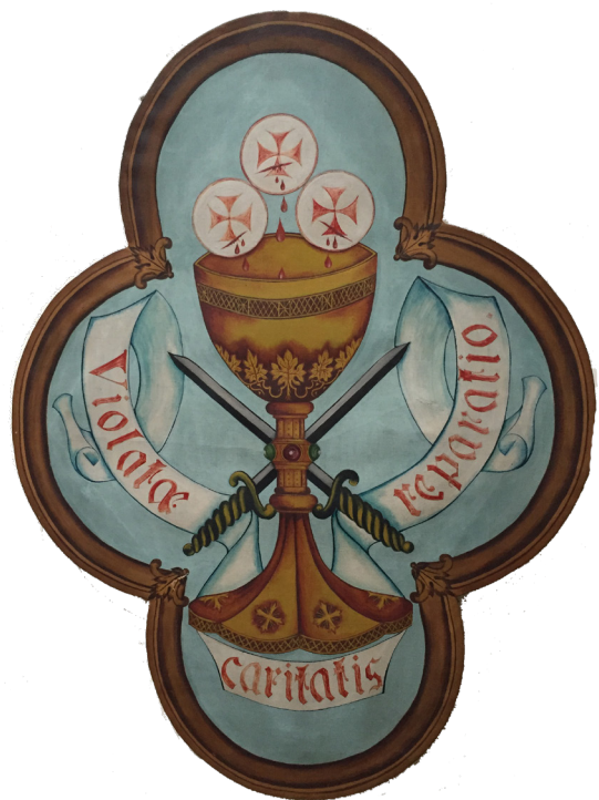
Het wapenschild van de Congregatie van de zusters van Gedurige Aanbidding met de leuze: VIOLATAE CARITAS REPARATIO "EERHERSTEL VOOR DE MISKENDE LIEFDE". Dit paneel hangt in de sacristie van het Allerheiligste Sacrament