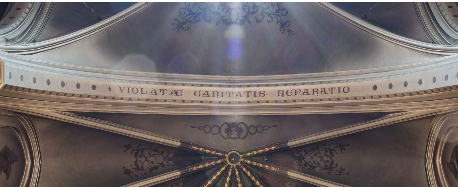
De leuze van de Congregatie van Gedurige Aanbidding op de gordelboog voor het altaar in de grote kapel in de Hemelstraat