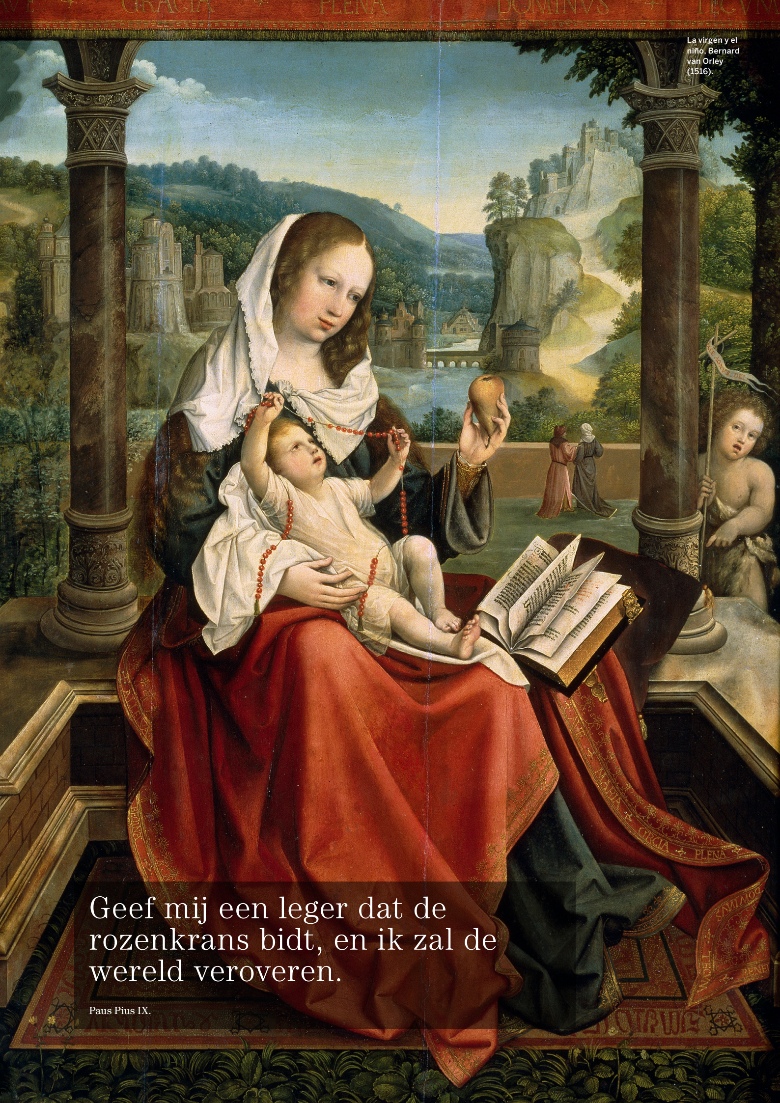
La virgen y el niño, Bernard van Orley (1516).

Geef mij een leger dat de rozenkrans bidt, en ik zal de wereld veroveren.