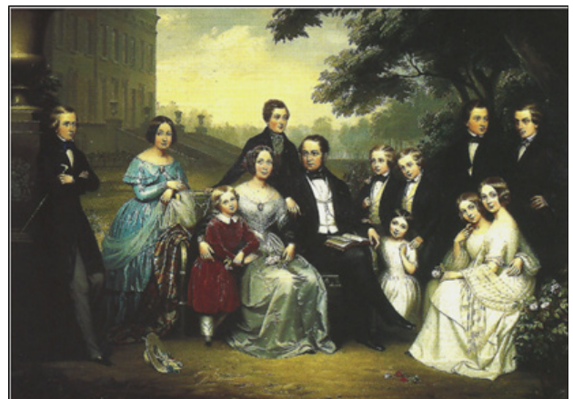
Graaf en gravin de Meeûs met hun 11 kinderen voor het eerste chateau d'Argenteuil vóór het afbrande in 1847

Medestandster van het eerste uur was Fanny de Kestre (1824-1882). Deze vriendschap liep echter spaak en de Kestre stichtte haar eigen vrouwenvereniging. Beide congregaties profileerden zich in de daaropvolgende decennia als promotors van de sacramentscultus en deden aan werken voor