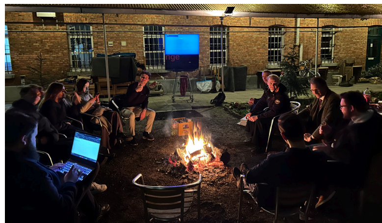
JKI-bijeenkomst van maart 2023: bezoek aan de Sint-Joriskerk te Antwerpen en gezellig kampvuur in de Hemelstraat.