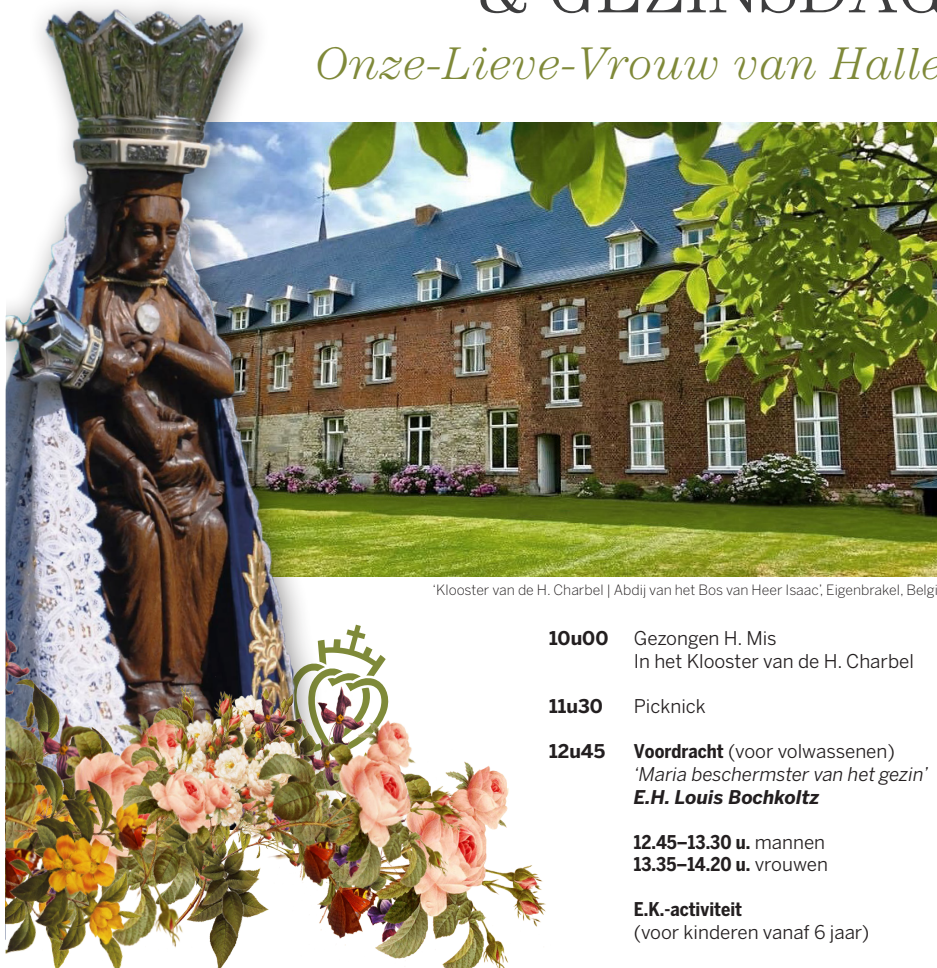
*Klooster van de H. Charbel | Abdij van het Bos van Heer Isaac, Eigenbrakel, België

INSCHRIJVING VAN FAMILIES MET KINDEREN VERPLICHT VOOR ZONDAG 23 MAART GEZINSWEEKEND@FSSPX.BE