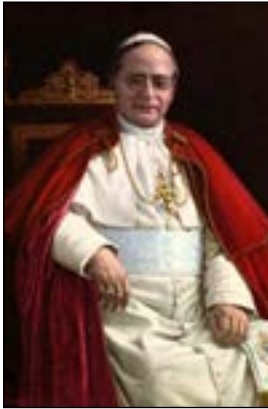
Paus Pius XI

Daarom heeft de katholieke Kerk zich altijd ingespannen, om zowel de niet-christenen te bekeren als ook de leden van de van haar afgescheiden christelijke gemeenschappen tot de eenheid van het Mystiek Lichaam van Christus terug te geleiden. Deze inspanningen richtten zich meestal op de individuele mens, maar soms ook op hele van haar gescheiden gemeenschappen. Zo probeerde men op het Concilie van Lyon en Florence tot hereniging te komen met de Oosterse Kerk,