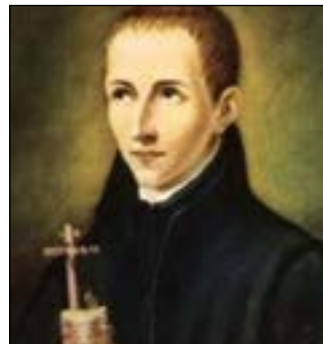
H. Jan Berchmans

Zodanig waren jeugdige Heiligen, zoals bijvoorbeeld een Agnes, een Aloïsius van Gonzaga en een Jan Berchmans. Daarom ook zien zij thans in de Hemel, in hun Vaderland, de goede God, zoals Hij is, van aangezicht tot aangezicht.