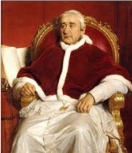
Paus Gregorius XVI

Dat de godsdienstvrijheid vroeger inderdaad veroordeeld werd, moge een paar citaten aantonen. Pius IX veroordeelde in de encycliek Quanta cura “de onjuiste mening voor te staan, een mening hoogst verderfelijk voor de Kerk en het heil van de zielen, die onze voorganger Gregorius XVI waanzin noemde, dat namelijk de