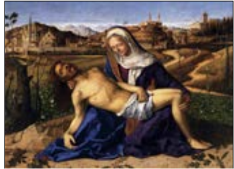
Piëta, Giovanni Bellini, 1505

Bij de aanroeping van God de Zoon, voegen wij het woord Verlosser bij, omdat het verlossingswerk, ofschoon in de raadsbesluiten van de drie goddelijke Personen vastgesteld, toch eigen is aan de Zoon. Hij alleen immers nam de menselijke natuur aan, zodat wij aan Hem niet kunnen denken, zonder ons de onuitsprekelijke weldaad van de verlossing te herinneren.