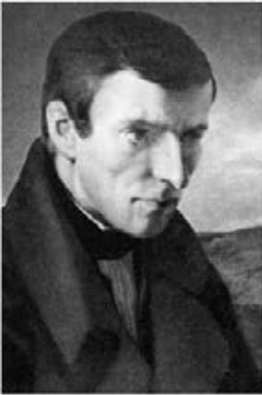
Félicité de Lamennais.

dienen en met de Communie te sterken. De priester zegt: “Maak alles in orde met de goede God! Hij komt u waarschijnlijk naar het eeuwige leven halen! Wees bereid Zijn wil te volgen!” Rustig tuurt Lamennais door het raam en zegt: “Goede medebroeder, maakt u zich geen zorgen! Ik heb als vriend van Jezus geleefd! Ik heb mijn bezittingen met de armen gedeeld en mijn vijanden vergeven. Als de goede Heer mij nu komt afhalen ben ik helemaal bereid! Zijn wil geschiede!” Intussen bidden alle vrienden van Priester Féli Lamennais: “Lieve Heer, laat hem toch nog leven! Hij zou nog zoveel goeds kunnen doen!” En ja: de goede God verhoort de gebeden! Lamennais knapt op en wordt door alle katholieken in Frankrijk gevierd als hun leider. Helemaal in de roes van het gebeuren schrijft Lamennais in 1824-25 weer een boek: hij valt daarin de nieuwe regering