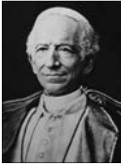
Paus Leo XIII

haar ook opvat- ten in deze zin, dat de mens in het maatschap- pelijk leven volgens zijn geweten onbe- lemmerd Gods wil ten uitvoer mag brengen en Gods geboden mag onderhou- den. Deze ware, aan de waardigheid van kinderen Gods passende vrijheid, die de waardigheid van de menselijke persoonlijkheid met ere handhaaft, staat boven alle geweld en onrecht. Deze vrijheid heeft de Kerk altijd verlangd en als een kostbare schat beschouwd”. 5