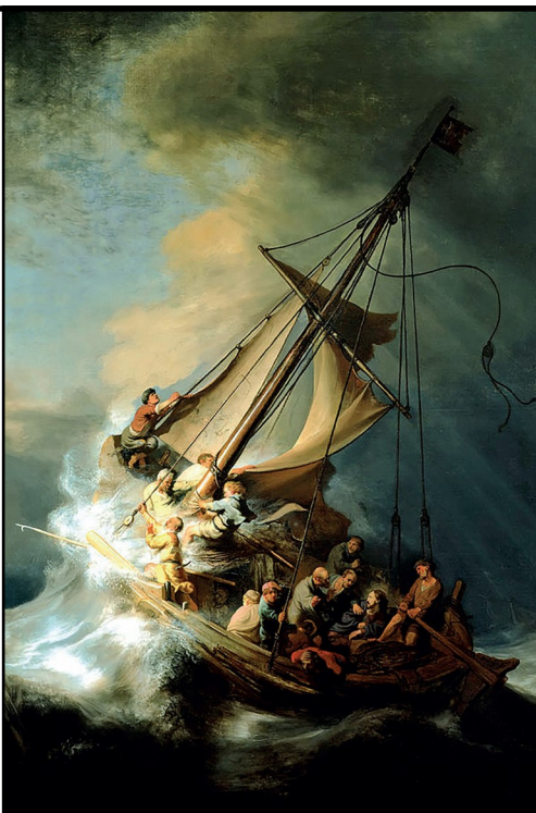
Jezus sprak tot het meer: « Zwiġg, wees stil! » De wind ging liggen, en het werd heel stil. (Mk 4, 39)

Christus in de storm op het meer van Galilea, Rembrandt (1633)