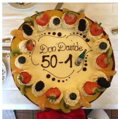
Oktober 2019. Toen de Algemeen Overste de Hemelstraat bezocht, vierden wij zijn 50ste verjaardag met de confraters van het District Benelux.

van gebruikmaken om ons “huisarrest” in een soort vrolijke familieretraite te veranderen, waarin het gebed de plaats, de tijd en de waarde terugkrijgt die het verdient. Laten we het Evangelie in zijn geheel lezen, het rustig overwegen, het in vrede beluisteren: de woorden van de Meester zijn de meest doeltreffende, want ze dringen gemakkelijk tot het verstand en het hart door.