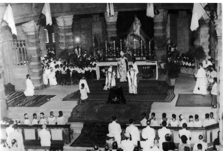
Boven: de kathedraal van Dakar, zuidportaal – Onder: 16 november 1947, de aanvaarding van de Bisschopszetel van Dakar.

ben ik opnieuw naar Frankrijk vertrokken om er de Paters Maristen te ontmoeten, in het bijzonder Pater Thomas, Overste van de Franse Provincie die zich in Saint-Brieuc bevond.